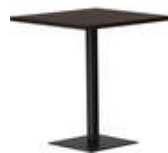
rq light t-2004