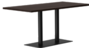
rq light t-2002