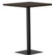
rq light t-2006