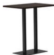
rq light t-2009